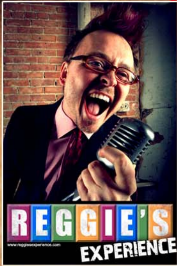
LOGO AND PHOTOS (continued)